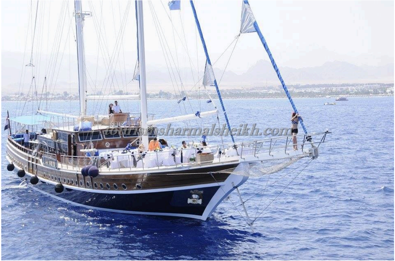
بعض الصور من يخت سينا دريم