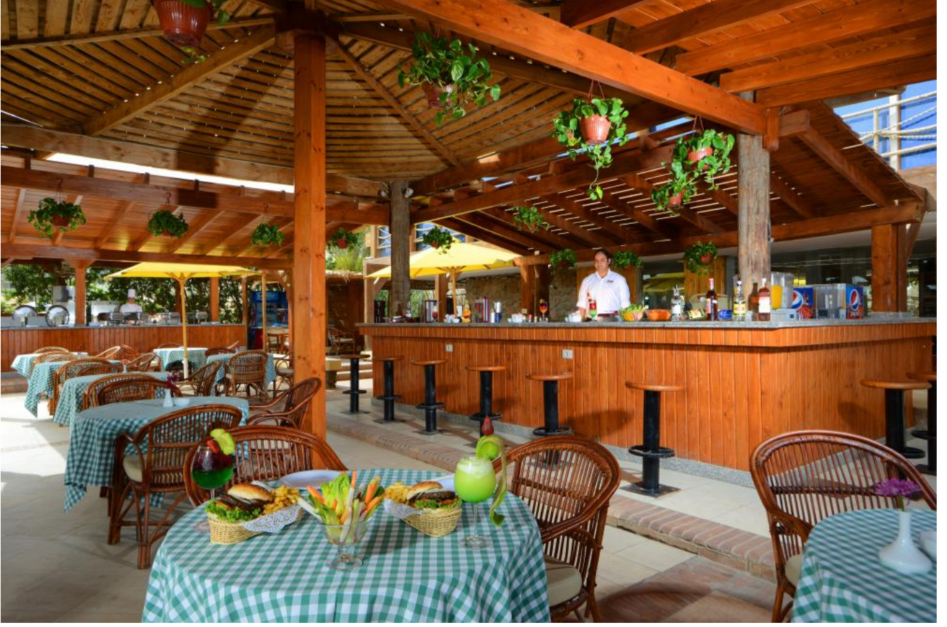
البار اللي في الشاطئ وهنا محل المساج التابع للفندق