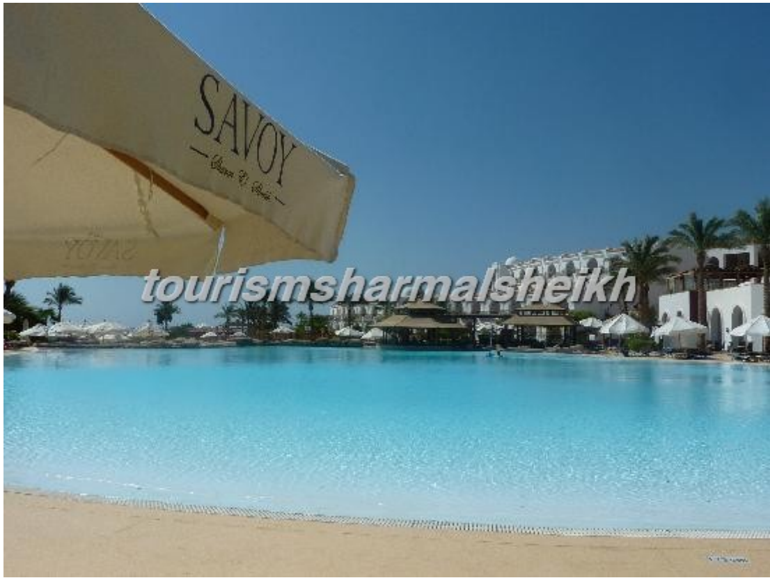
صور من الشاطئ في الفندق