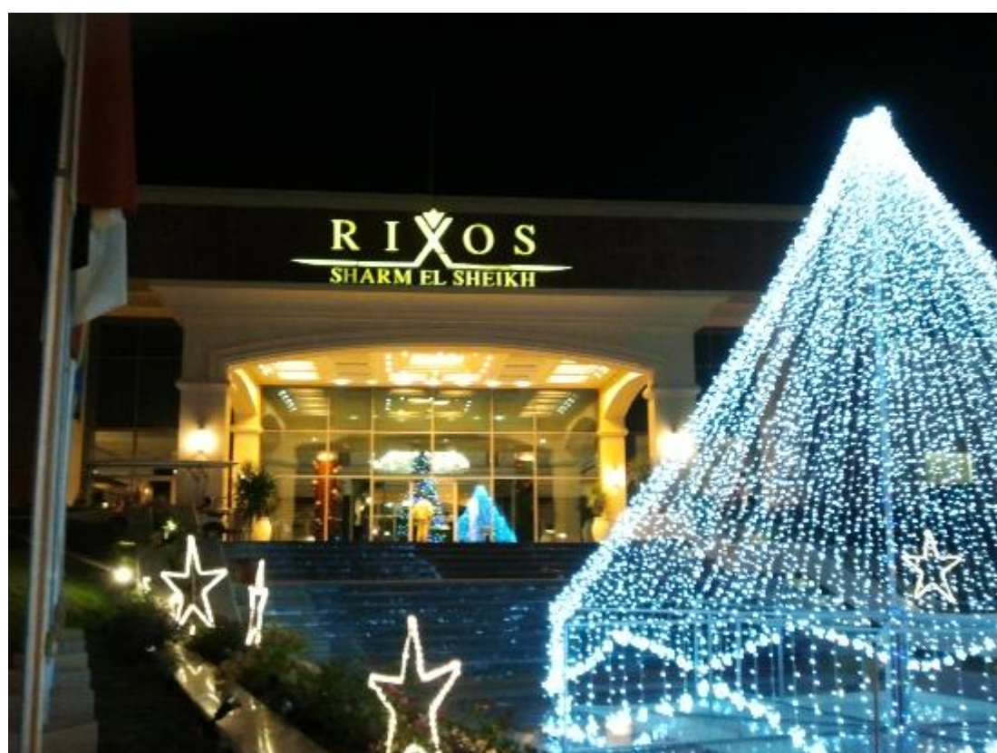
the lobby هنا لوبي الفندق