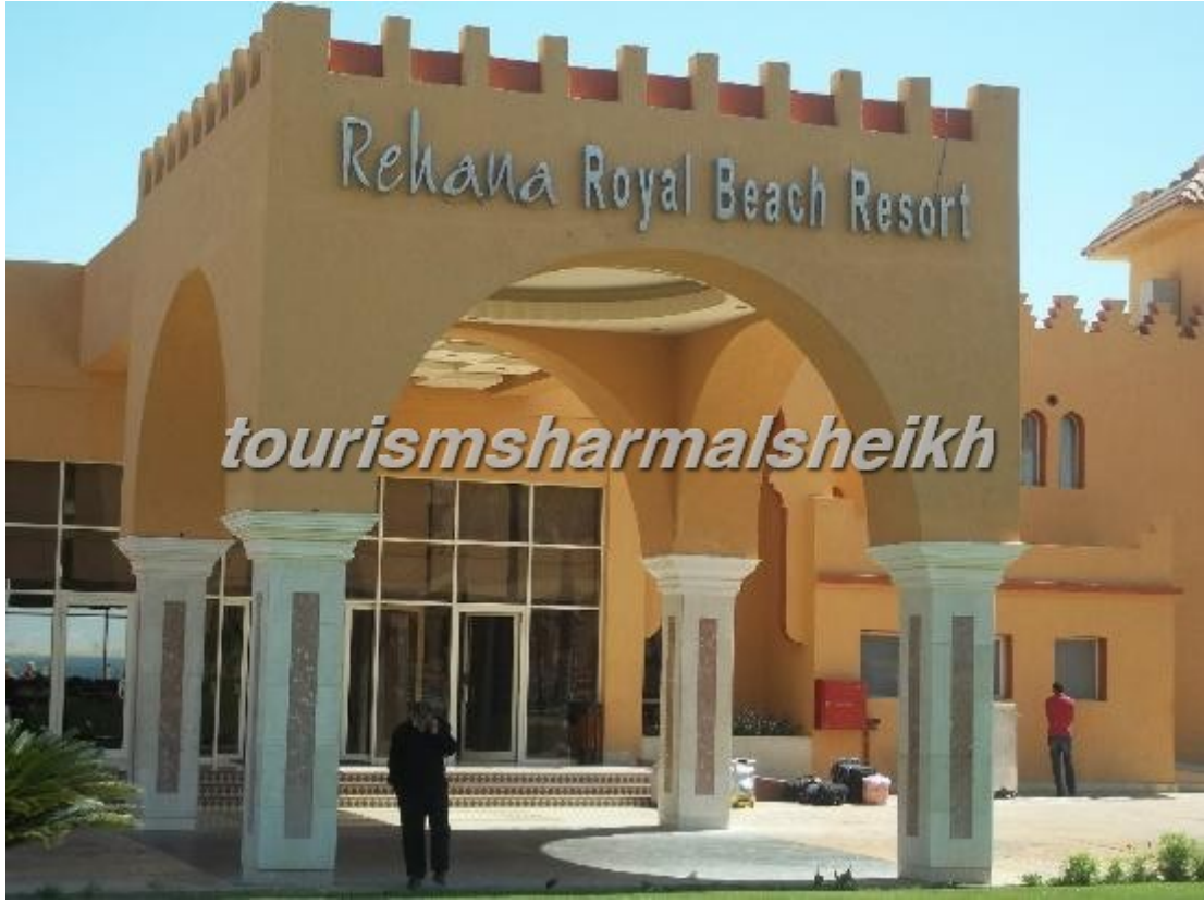
هنا صور للمدخل و اللوبي في فندق ريحانة رويال بيتش ريزورت